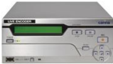
ADMENIC NEB (ネットワークエンコーダ)

5) 標準化への対応状況、未達成の場合対応予定および対応のための追加費用の有無：