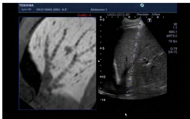
図2 腹部（肝臓）超音波検査でのSmart Fusion

超音波プローブの位置、傾きを検出し、CT/MRIのボリュームデータから同じ断面を切り出すことで、CT/MR画像と心エコー図を同期させ、リアルタイムにside by sideで表示する。