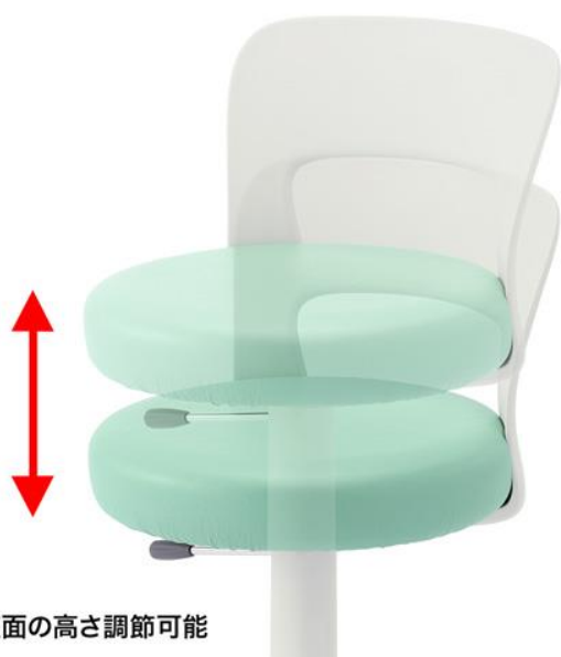
座面の高さ調節可能