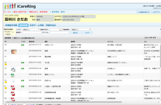
患者情報共有画面

5) 標準化への対応状況、未達成の場合対応予定および対応のための追加費用の有無：