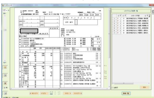
レセプトチェック内容確認画面