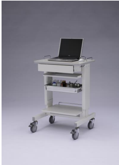
オプション装着例