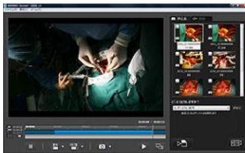
ADMENIC Client Software