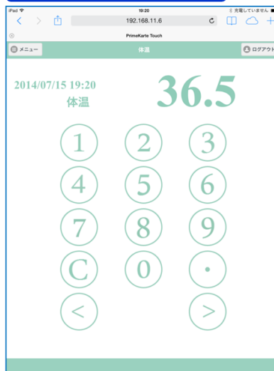
バイタル入力画面 (例)