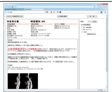
Web ブラウザでのレポート参照例