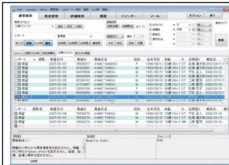
レポートリスト画面