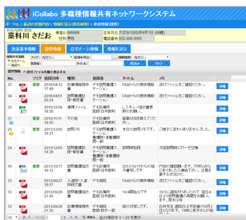
患者情報共有画面

5) 標準化への対応状況、未達成の場合対応予定および対応のための追加費用の有無：